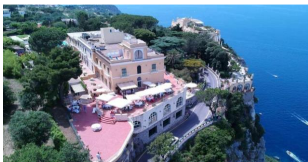
Grandiose Lage Ihres Hotels auf Capri