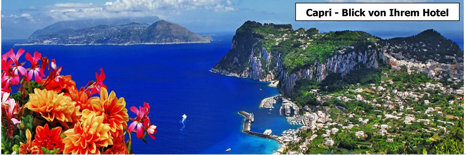
Capri - Blick von Ihrem Hotel