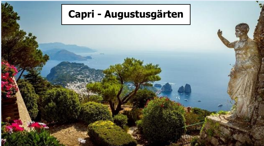
Capri - Augustusgärten

Die Traumreise Ihres Lebens - Exklusiv bei dieser Reise mit Hotels DIREKT BEI Amalfi und DIREKT AUF der Insel Capri - in der exklusivsten, allerschönsten Gegend! Mit Übernachtungen direkt bei Amalfi erleben Sie den Ort auch am Abend im zauberhaften Lichterglanz ganz exklusiv , ohne die tausenden Tagesgäste und durch die zwei Übernachtungen direkt auf der Promi-Insel gehört Ihnen auch Capri abends ganz exklusiv!