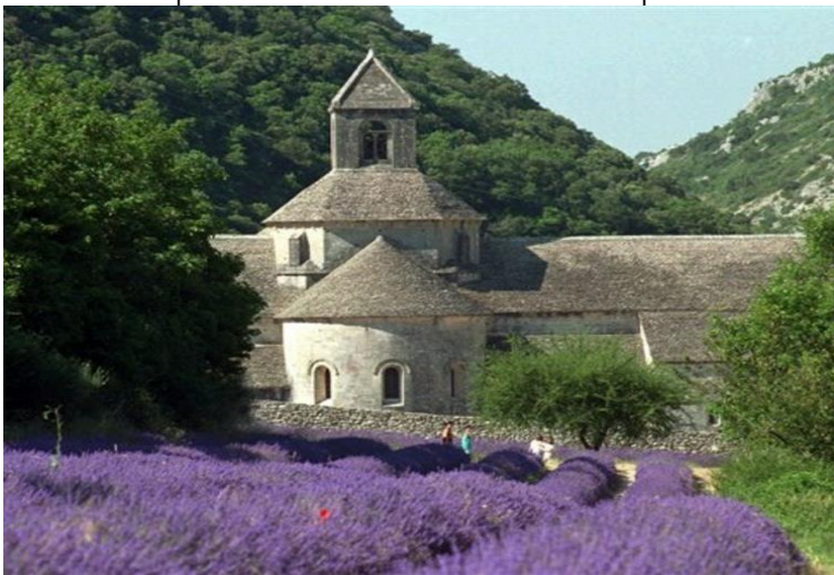
Abbaye de Senanque

7-TAGE: Mo, 28. Juni – Fr, 04. Juli 2025