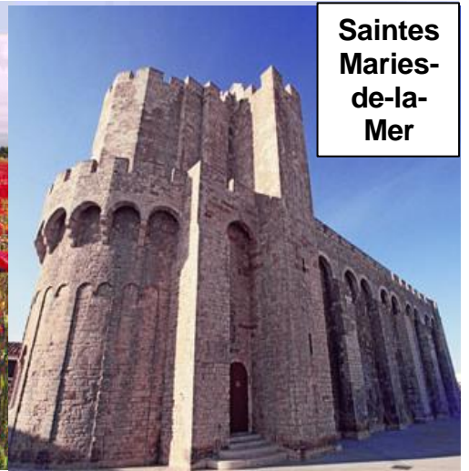
Saintes Maries- de-la- Mer