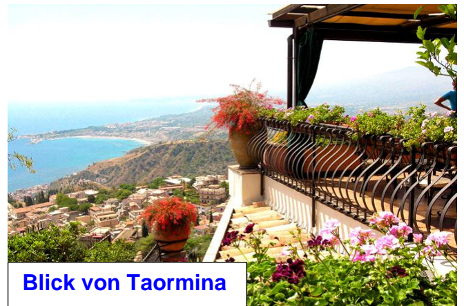
Blick von Taormina

kompetente, erfahrene Christian Reisen – Reiseleitung!