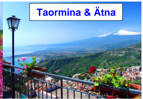
Taormina & Ätna